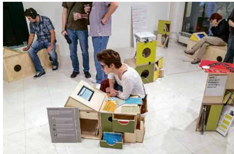
Web stranica pocetnica.org dostupna je i na tabletima unutar mobilijara Početnice