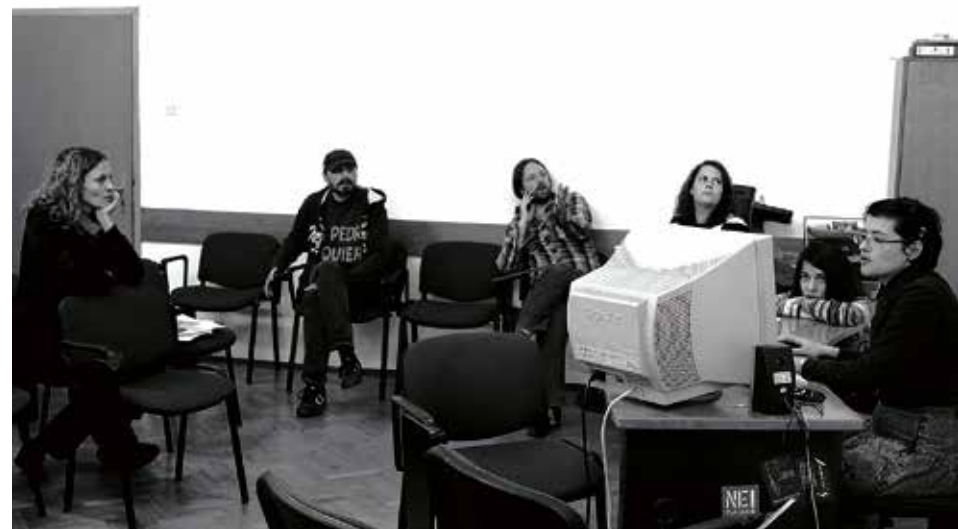
Sastanak grupe Direktna demokracija u školi, Filozofski fakultet u Zagrebu, 2014

2012. godine Direktna demokracija u školi se uključila u aktivnosti usmjerene na uvođenje građanskog odgoja i obrazovanja u škole (izrada kurikuluma građanskog odgoja i obrazovanja, edukacija nastavnika, eksperimentalno izvođenje ovog predmeta u školama), a angažirala se i u radu "Inicijative za kvalitetno uvođenje odgoja i obrazovanja za ljudska prava i demokratsko građanstvo" te Koordinacije ove inicijative.