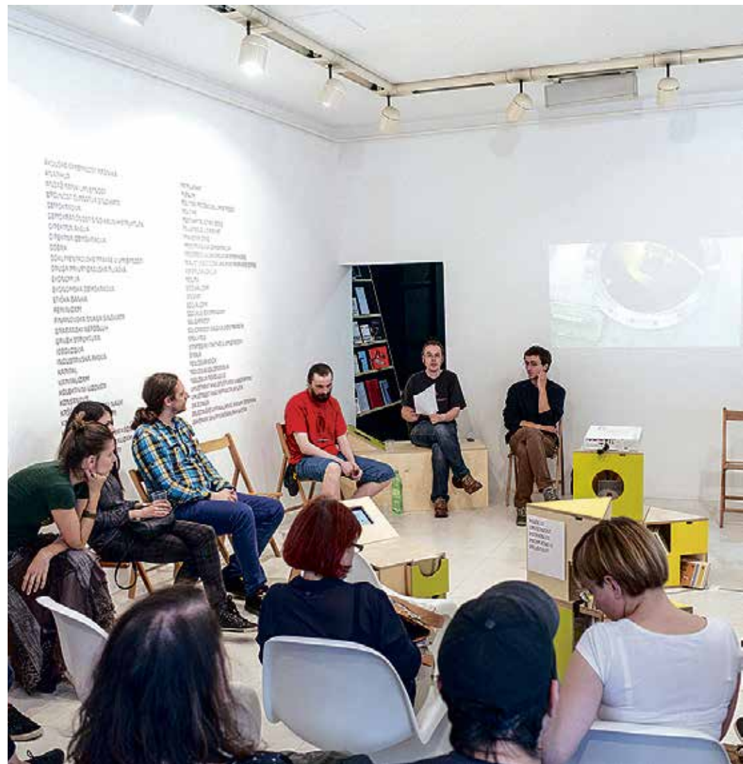
Radionica i predavanje o direktnoj demokratiji u Galeriji Nova, 2014

Uvod u direktnu demokratiju u radu s polaznicima radionica započinje poticanjem na promišljanje samog pojma demokratije kao vladavine naroda. Time se otvara prostor za kritičko sagledavanje današnjih sustava koji sebe nazivaju demokratskim, što znači suočavanje s konceptom predstavničke demokratije. Analizom predstavničko-demokratskog sustava i ukazivanjem na njegove nedostatke priprema se podloga za prikaz direktno-demokratskog sustava koji se, u usporedbi s drugima, pokazuje kao prikladnije rješenje. Zadnji dio radionice posvećuje se raspravi u kojoj se definira i mogući zajednički interes polaznika radionice na osnovi kojeg bi se mogli direktnodemokratski organizirati. Svakoj grupi koja izrazi interes i pokaže volju za daljnje djelovanje na direktnodemokratski način članovi grupe Direktna demokratija u školi su na raspolaganju za pomoć oko uvođenja takvog sustava u praksu prilagođenog njihovim potrebama i uvjetima djelovanja.