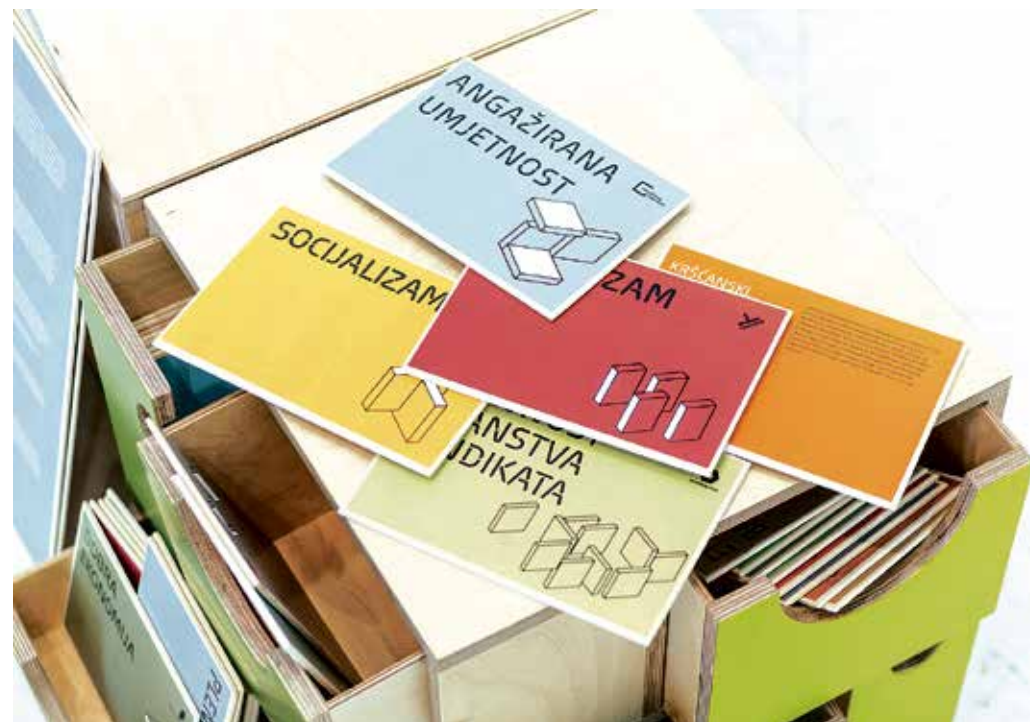
Segment Početnice s pojmovima

DIREKTNA AKCIJA DIREKTNA DEMOKRACIJA DOBRA EKONOMIJA EKONOMSKA DEMOKRACIJA ETIČKA BANKA IDEOLOGIJA KAPITAL KAPITALIZAM KONSENZUS LIBERALIZAM: Ekonomski i socijalni liberalizam LIBERALIZAM: Neoliberalizam