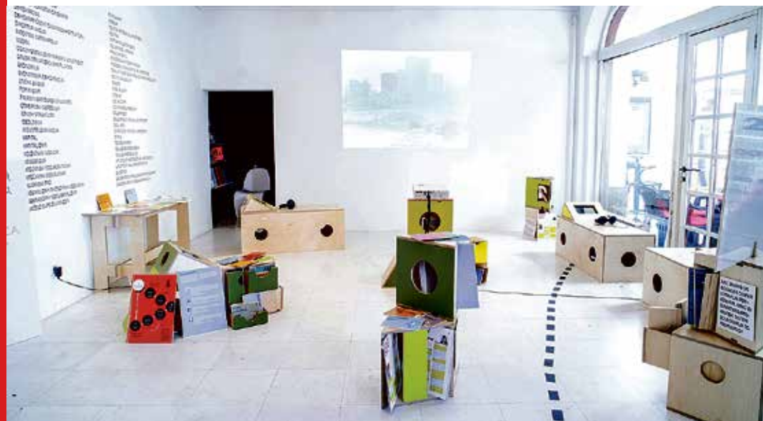
Početi najbolje što se može, početnica zajedničkog djelovanja, Galerija Nova, 2014.

Početnica je multimedijalna umjetničko-edukativna instalacija kolektivnog autorstva. Istodobno funkcionira i kao alat interakcije koji sadrži pojmovnik, kartu, zbirku angažiranog video-materijala, arhivu dosadašnjih radničkih borbi i literaturu iz područja direktne demokracije, sindikalizma, feminizma, teologije oslobođenja, prava na grad, održivog življenja i angažirane umjetnosti. Paralelno s pokretnim elementima u prostoru, tzv. mobilijarom, Početnica postoji i na internetu.