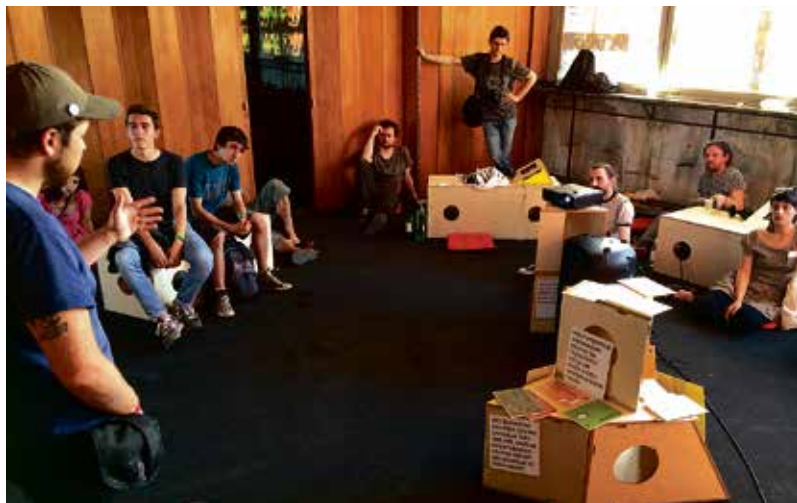
Gostovanje Početnice na Festivalu Željezara, Sisak 2014.

Suradnjom s osobama različitih profila, umjetnicima, kustosima, sociolozima, filozofima i aktivistima ostvaruju se nove veze. Uključivanjem subjekata autorica projekta ne zauzima superiornu ili patronizirajuću poziciju, niti govori umjesto obespravljenih ili zanemarenih članova društva, već ih osnažuje da sami govore i omogućuje da se njihov glas javno čuje. Inkluzivan pristup ne samo da je u temeljima djelovanja MAPA-e da je dosljedno provoden od strane Andreje Kulunčić, nego je i u skladu s načinom na koji se razvija publika; ona je sve manje pasivan promatrač i manje zazire od sudjelovanja, postajući aktivniji sudionik sa željom da doprinese promatranom sadržaju. Iako ju radi osjetljivih društvenih tema karakterizira ponekad nepredvidiv odnos s protagonistima izvan kulturno-umjetničkog kruga koji se značajno razlikuju od publike kontroliranog okruženja galerija većih urbanih centara, ovako angažiran program doseže široki krug "neumjetničke" publike i pokreće zajednicu impulsom iniciranim umjetničkim radom i solidarnim djelovanjem okupljenih aktera.