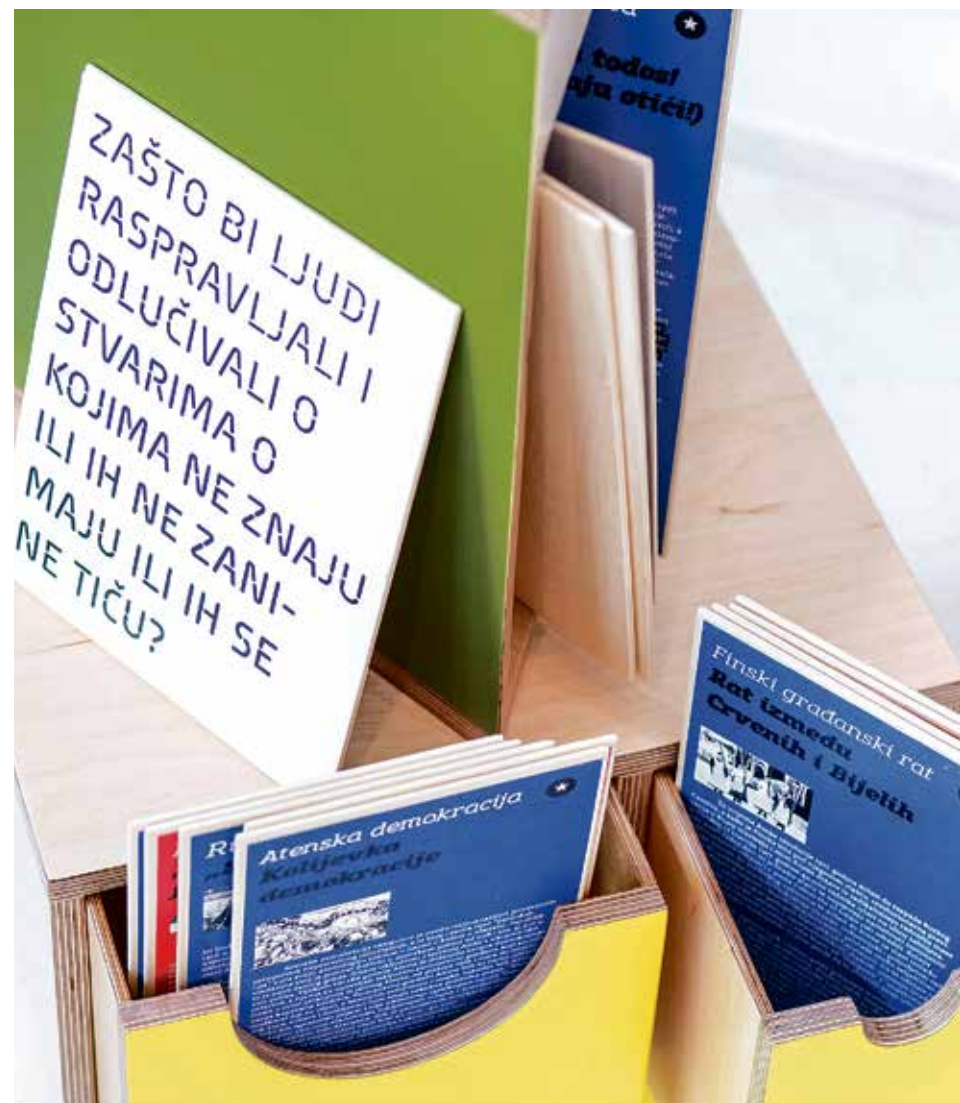
Segment Početnice sa svjetskim primjerima promjena i pitanjima za raspravu.

Dva su glavna modela demokracije: predstavnička i direktna demokracija.