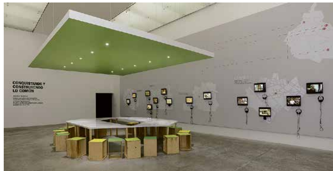
"Kreativne strategije" - multidisciplinarni aktivistički projekt, Museum MUAC (Museo Universitario Arte Contemporáneo), samostalna izložba "Conquering and Constructing the Common", Mexico City, 2013.

Problemi pojedinca i zajednice u svakodnevnom životu za koje nema postojećih rješenja, ili su se stara rješenja pokazala nedovoljno funkcionalnima, rješivi su inovativnim strategijama, odnosno kreativnim stvaranjem novih rješenja. Ona su stoga podjednako suštinska kako u mikro-situacijama pojedinačnog snalaženja u novim uvjetima, tako i za poticanje općih