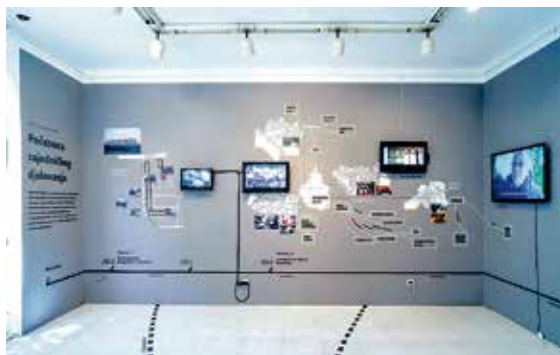
Početi najbolje što se može, početnica zajedničkog djelovanja, Galerija Nova, 2014

2015. Projekt Kreativne strategije: Početnica uvršten je u arhiv Arte Útil, "korisne umjetnosti" http://www.arte-util.org/ .